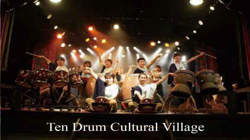
Ten Drum Cultural Village